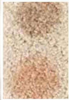
PRIMA Vino rosso/succo d'arancia